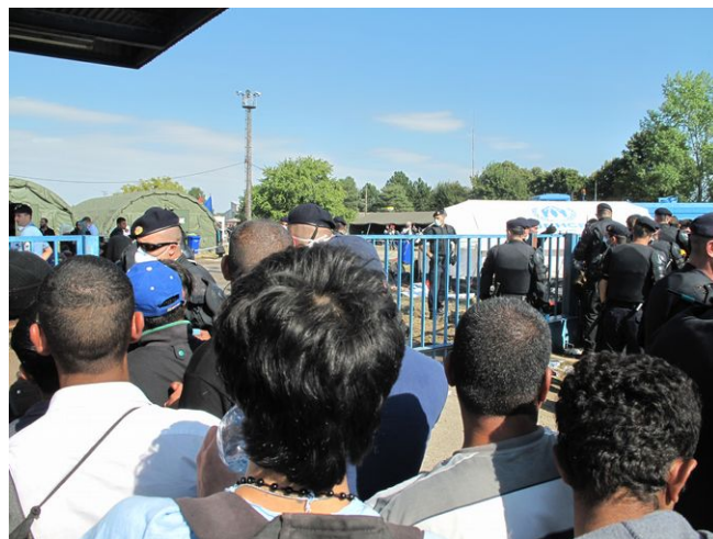
Foto: Vor dem Lager in Opatovac warten die Menschen seit dem Abend zuvor auf Einlass. Das Militär riegelt alles ab.

In den folgenden Stunden erreichen einige weitere HelferInnen das Lager und eine minimale Versorgungsstruktur beginnt. Die Médecins Sans Frontières (Ärzte ohne Grenzen) haben ein Zelt aufgebaut, es gibt heißen Tee und ein paar Informationen. Doch noch immer kommen die Menschen zu Fuß an. Die Busse, welche sie in Šid bestiegen hatten, scheinen sie nur ein paar Kilometer außer Sicht der dort anwesenden Volunteers gebracht und einem weiterhin langen Fußmarsch ausgeliefert zu haben.