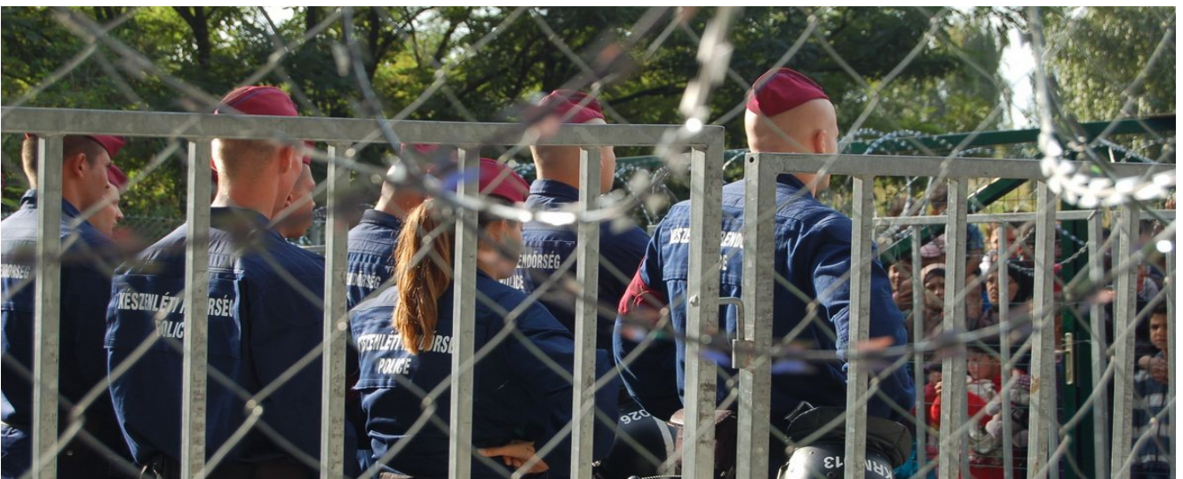
Oben: Schutz vor Tränengas Mitte: Unser Sammlager für Spenden, nach dem Tränengasangriff zerstört Unten: Ungarisches Militär an der Grenze. Die Menschen werden nicht durchgelassen