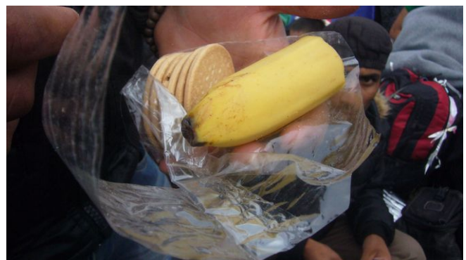
Foto: Die Tagesration, wie sie vom Roten Kreuz in Opatovac ausgeteilt wird

Teilweise sind die Zelte so überfüllt, dass die Menschen gezwungen sind, ihre Raststätte neben den Müllcontainern und Dixis zu errichten. Bis vor das Lager ist der Gestank zu riechen, der hier in der Luft ist – nicht zu sehen sind von dort die Müllberge, zwischen denen Menschen, auch Kinder, schlafen müssen. Die Dixis sind teilweise geschlossen, teilweise nicht geleert worden.