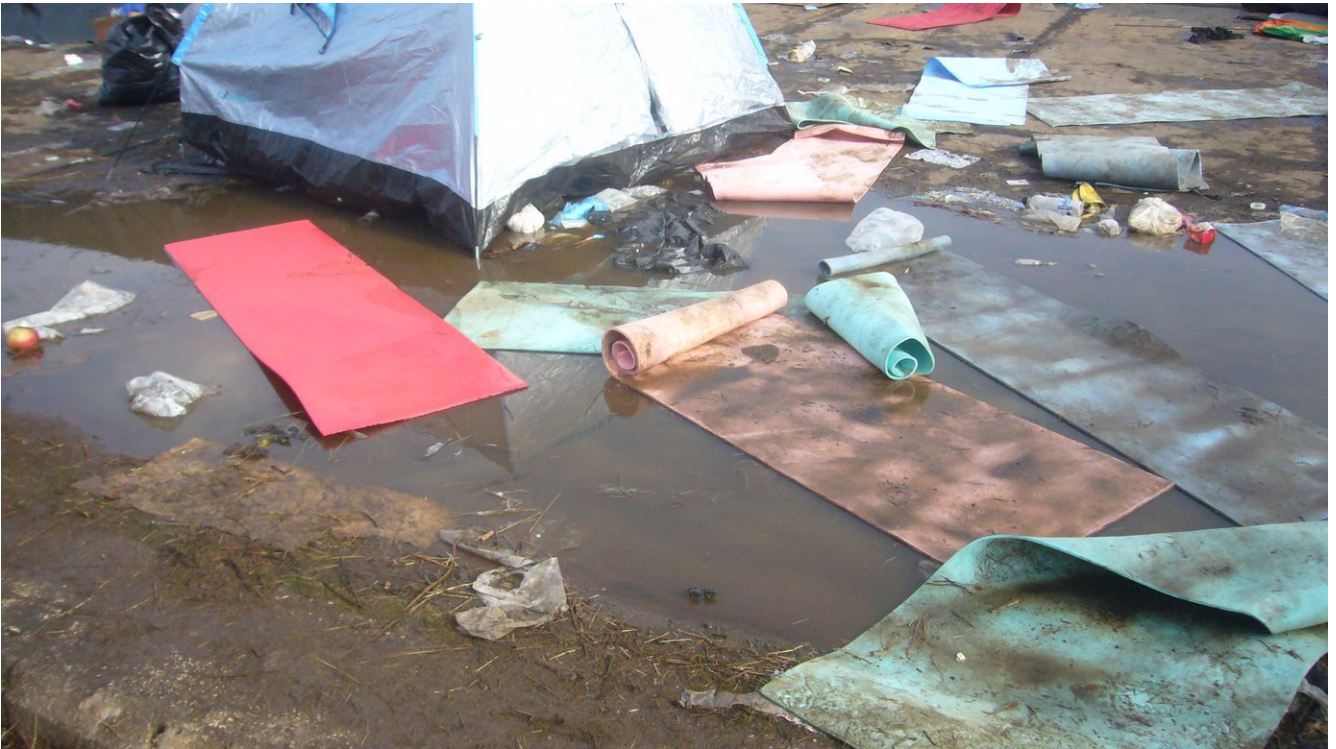
Oben: Das Innere eines Zeltes im Lager Unten: Auch in der regnerischen Nacht fanden etliche Menschen nur draußen einen Schlafplatz.